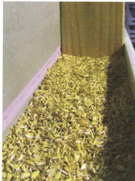
Balle de riz en remplissage de caisson isolant.